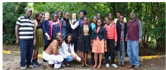
Bijna alle aanwezigen van de studentendag 2017.