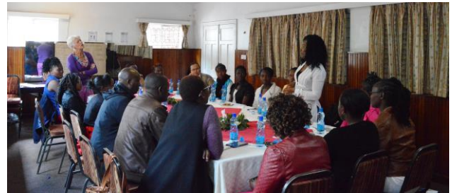
De studentendag 2017, tijdens het rondje

School. We ervaren steeds meer dat de contacten in Kenia essentieel zijn voor het goed functioneren van Kids to School aldaar. Hartelijk dank allemaal.