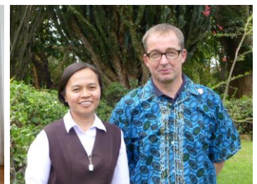
Impressies van onze bijeenkomst in Nairobi