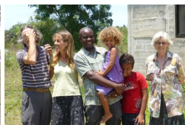
Impressies van de Baobab Home